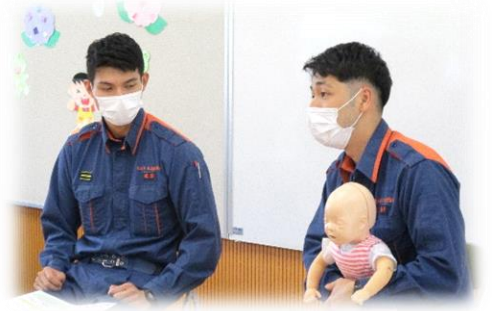
講師：北はりま消防本部の消防士さん