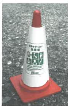
【駐車場での設置例】