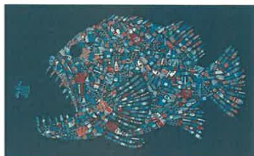
増え続ける海のごみ