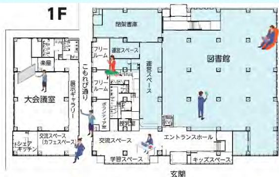
まちづくりプラザ平面図

参加はお子様とご一緒でも OK です。当日は、託児所も開設します。 託児所をご利用の方は、お申込み時にお子様の人数と年齢をお伝えください。