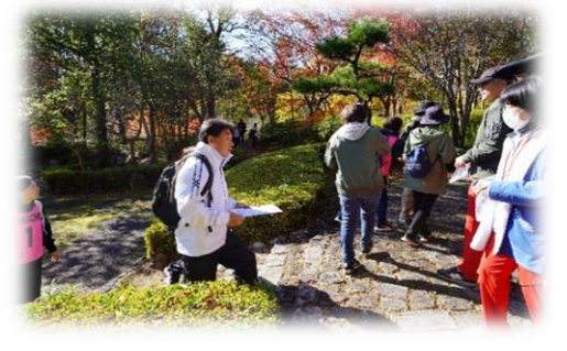
▲重さ予想の様子 50gピッタリを目指して