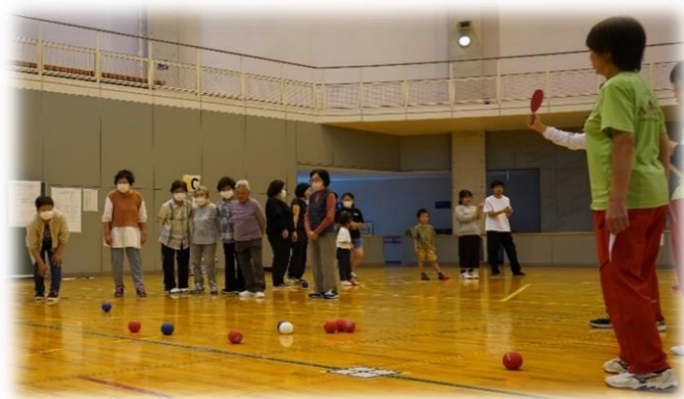
▲参加者も多く とても盛り上がったポッチャ大会！