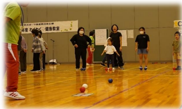
▲ファミリーバドミントンの様子

さあ、次回の第4回目は、ポッチャ大会です！ 皆さん優勝を目指して頑張ってくださいね。（スポーツ推進委員 藤田）