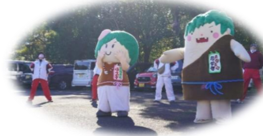
▲たか坊・ふう子も登場！

60名の申込みがあり、〇×クイズ・つり橋を20秒で渡れるか・モルック・重さ予想・輪投げ・グラウンドゴルフ・妙見スカイローラーの長さクイズ・大縄跳びと8つのチェックポイントがあり、余暇村公園内をくまなく散策して頂きました。