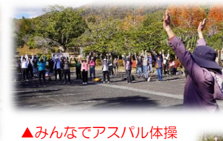
▲みんなでアスパル体操