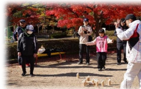
▲モルックの様子 やったー！と歓声があがります