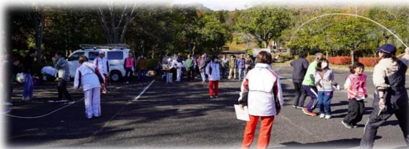
▲大縄跳びに挑戦 何回跳べるかな？