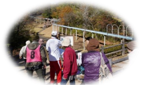
▲妙見スカイローラーに挑戦