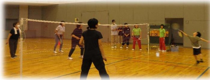
▲子ども元気いっぱいにファミリーバドミントンを楽しみました