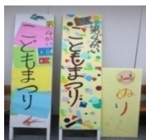
すてきな看板が完成！