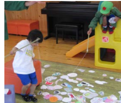
さかなつりゲーム！