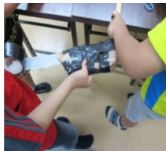
グランドゴルフ～マイクラブを作ろう！