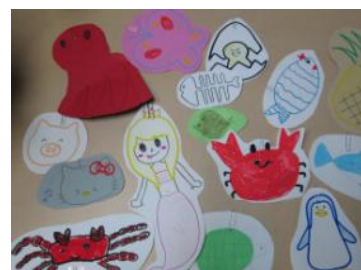
「ギョッとする魚」 みなみ児童館