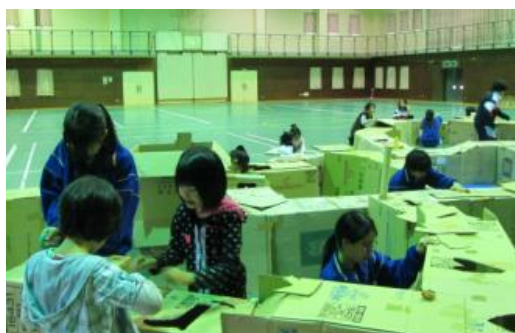
5月子ども教室「巨大迷路」外と中