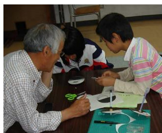
おもしろ科学教室「ベンハムのこま」