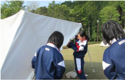
朝、8時集合 会場の設営