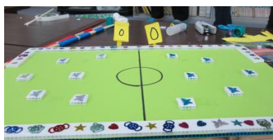
ずこう「パチンコ玉サッカーゲーム」