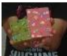
工 作 「牛乳パックの鉛筆立て」