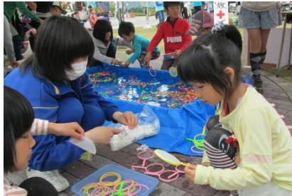
「スーパーボールすくい」

当日来場者の小学生による「こども店員」、「店長役」は中学生です すくいあみに紙をセットする「お仕事」をしているところです