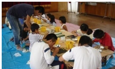
ずこう「スライドパズル」