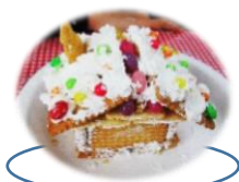
屋根に雪をのせたり (ホイップクリーム)