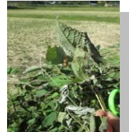
ちょこっとうさく 「はねロケット」