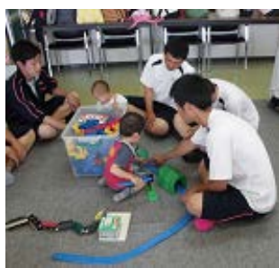
おもちゃを使ってふれあい遊び