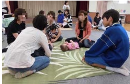
グループに分かれてトークタイム☆