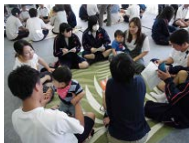
高校生からお母さんに妊娠・ 出産・子育てについて質問