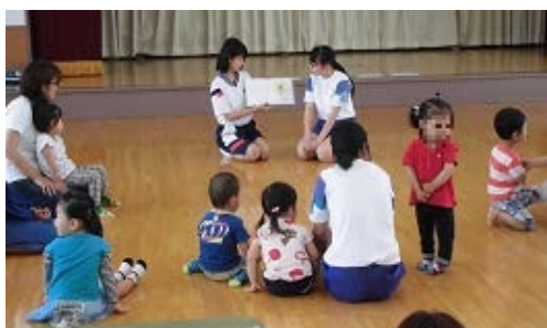
絵本の読み聞かせをしてもらったよ♪