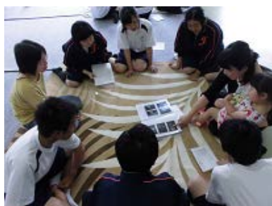
母子手帳やエコー写真を見せて もらいます