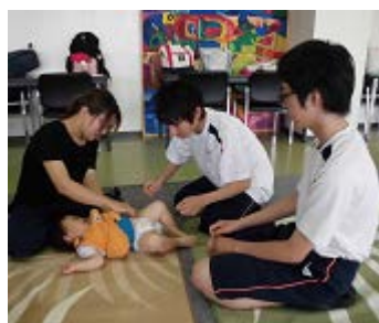
男女にわかれておむつ替え体験