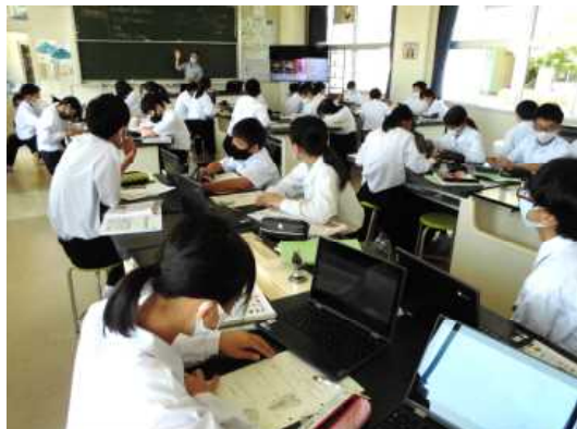
1年生理科、PCを活用した授業

蒸し暑く、ぐずついた天気が続いています。学校では教室のエアコンを活用して、不快感を軽減しながら授業を進めています。