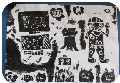
2年生紙版画作品より