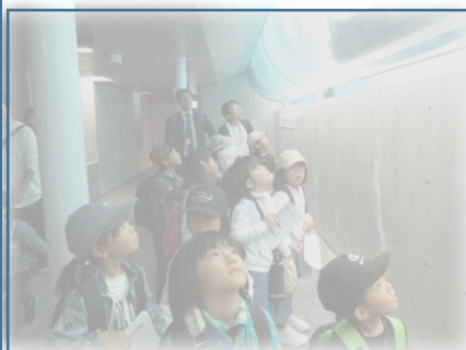
2年生社会見学： 城崎マリンワールド