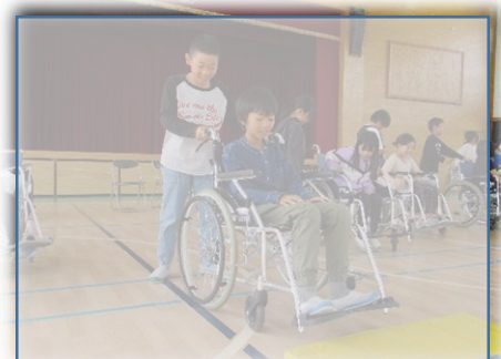
4年生福祉体験： 左：手話歌学習 右：車椅子体験