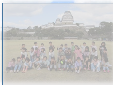
1年生社会見学： 姫路動物園