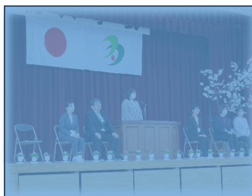
着任式で6名の先生方にあいさつして いただきました。

4月8日(火)に着任式、始業式を行い、9日(水) には16名の新入生を迎え、入学式を挙行了しました。 また、10日(木)にはお世話になった先生との別れ の離任式を行いました。いずれの式も、子どもたちの 大きく元気な声が響き、よいスタートとなりました。 学校の情報をこの「すずかけ」をとおして発信してい きますのでご覧ください。