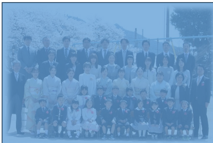
令和7年度の一年生は16名です。