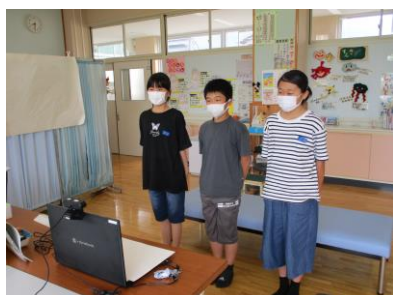
6月21日（月）のリモート児童朝会 保健給食委員会の発表の様子

印刷機が新しく替わり、カラー印刷が可能となりました。ただ、枚数制限がありますので、すべてをカラー印刷することは難しいですが、保護者の皆様に満足していただけるようできる限り活用して参ります。また、杉小ホームページは1週間に2～3回程度更新しておりますので、ぜひ子どもたちの活動の様子をご覧ください。