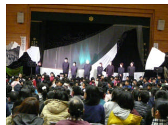
人形劇「あらしのよるに」

5時間目はそれぞれの学年で学年交流を行いました。5年生は来年度最上級生になるということで、新しい八千代小学校で活動するスローガンを話し合いました。