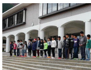
6年生が企画しました

6年生全員と若い先生2人がハンターとなり、1～5年生を追いかけてきました。最後まで逃げ切った子も…。