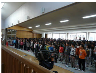
八千代小学校の校歌練習

朝から5時間目まで一日中3つの学校の児童と一緒に過ごした初めての取組でしたが、どの学年も仲良く交流ができ、子どもたちの絆がより一層深まるすばらしい一日だったと感じました。