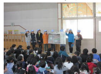
学校探検スタンプラリー

12月15日(火)、この日は八千代南・北・西小学校のすべての児童が八千代南小学校に集まり1日交流を実施しました。バスの通学訓練も兼ねて実施し、キッズランドの5歳児もバスに乗って八千代南小学校までやってきました。(キッズの5歳児は八千代南小学校に到着した後、通園バスでキッズランドへ向かいました)