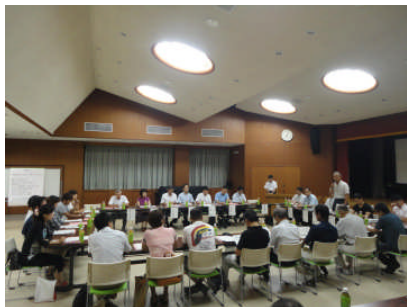
＜統合準備委員会の様子＞

統合準備委員会もいよいよ大詰めとなり、PTA部会で新小学校の会長、副会長、部長の選出方法やPTA役員の任期や役員の選出方法等の調整が終わっております。